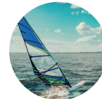
La Rabina www.rabina.it

Il microclima di Imperia, tra i più favorevoli del Mediterraneo, consente di vivere il mare anche nella stagione invernale. Alla Rabina un'ampia spiaggia di ciottoli, ottime condizioni di vento per il surf, windsurf e kitesurf, tanto sole e un'area giochi per bambini. Proseguendo verso levante, la spiaggia della Galeazza e la splendida passeggiata pedonale, a picco sul mare, che collega Imperia e Diano Marina. Il Circolo Windsurf della Rabina offre corsi per principianti e mette a disposizione attrezzature nuove e moderne per i più esperti.