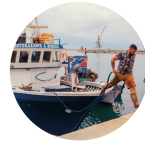
Pingone Pesca Turismo e Ristorazione a bordo Banchina di Calata Cuneo (Oneglia) pingonepescaiturismo.com +39 328704223

Il modo più emozionante per vivere il mare è partecipare ad una battuta di pesca. Pescatori locali, grandi amanti del mare, mettono a disposizione la loro passione per condividere escursioni giornaliere in motobarca e svelare i loro segreti di pesca tradizionale con reti da posta. La calata delle reti, ma anche i testi di palamiti e la suggestiva pesca serale a totani e calamari, sono tutte tecniche di pesca tradizionali da vivere in prima persona secondo la stagione.